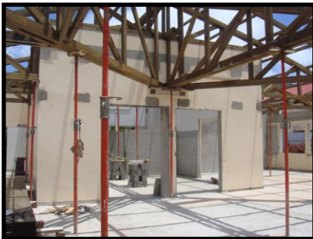
Travaux en cours