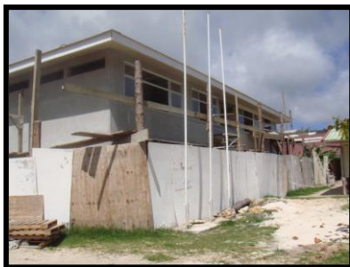
Photo avant du bâtiment en chantier