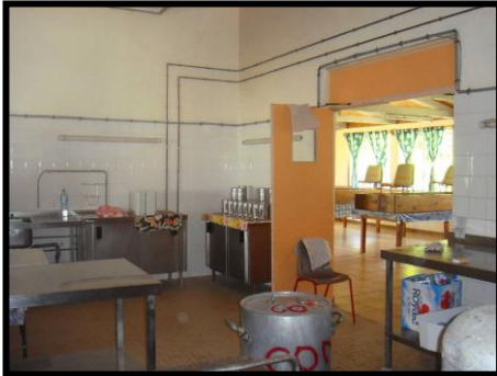
Avant les travaux